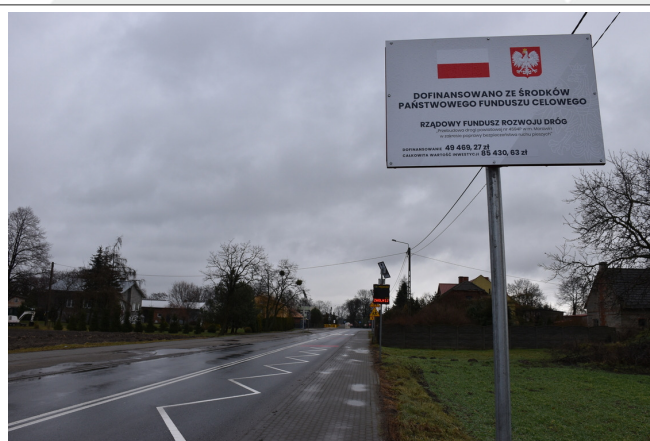
8. „Przebudowa drogi powiatowej nr 4609P w m. Dębe w zakresie poprawy bezpieczeństwa ruchu pieszych”