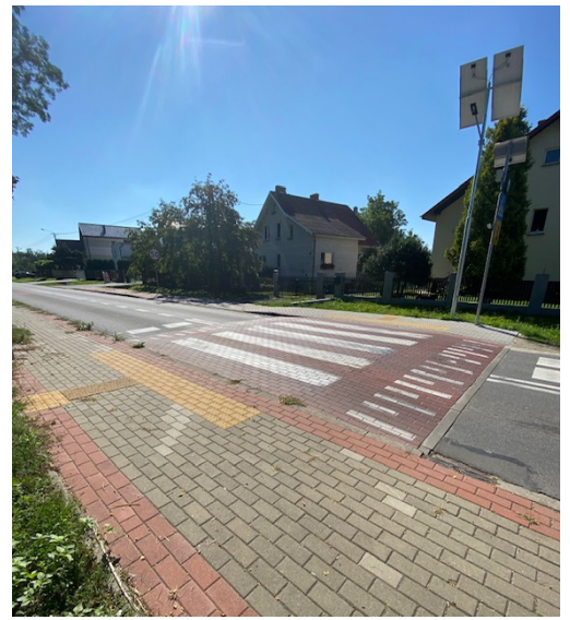
4. „Przebudowa drogi powiatowej nr 4630P w m. Wolica w zakresie poprawy bezpieczeństwa ruchu pieszych”