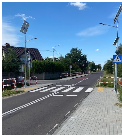
6. „Przebudowa drogi powiatowej nr 4584P w m. Zbiersk w zakresie poprawy bezpieczeństwa ruchu pieszych”